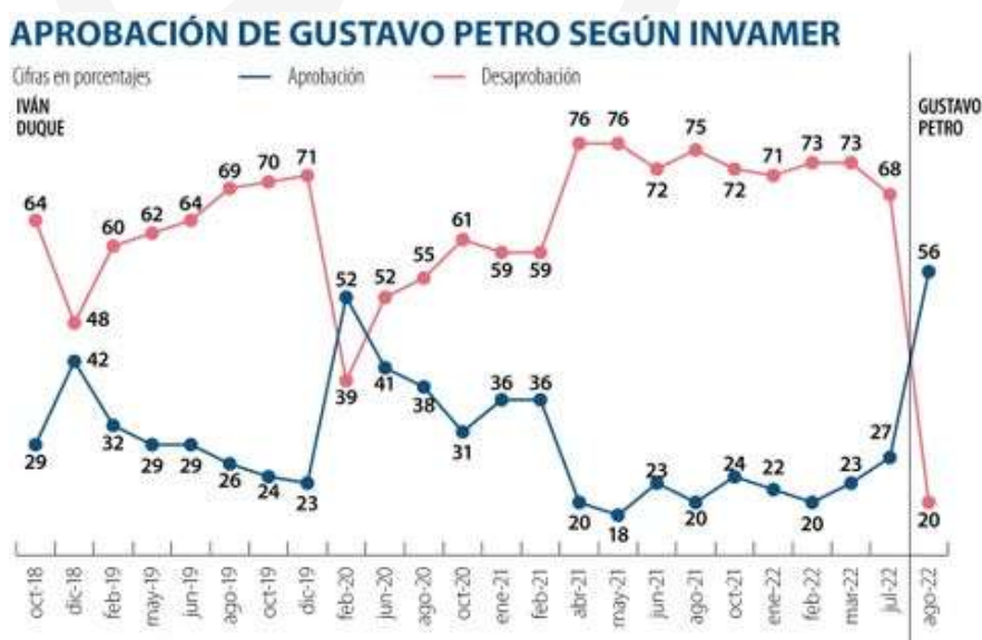
Figura 4. Favorabilidad de Petro a inicios de su mandato

El candidato del Pacto Histórico que, a logro de su longeva estrategia electoral, consiguió finalmente su victoria como cabeza ejemplar de la oposición, adquirió su vestigio popular (determinante de su buena favorabilidad al inicio de su mandato), gracias a representar la otredad relegada por la herencia hegemónica de un mandato de alta clase en el poder, mientras que, a su vez, consiguió con frugalidad su desvincular de ideas catastróficas (El País, 2022) que le asociaban a su homólogo venezolano (Chávez), de quien era simpatizante (La Silla Vacía, 2018).