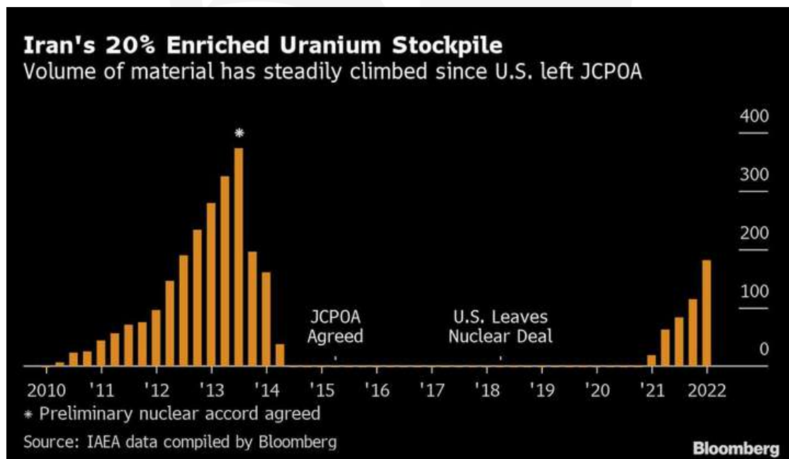
Figura 1: Aumento del enriquecimiento de Uranio en Irán Según el Organismo Internacional De Energía Atómica (OIEA)

Nota. En el gráfico se puede evidenciar el considerable aumento del 60% de uranio almacenado, al 83% según la OIEA.