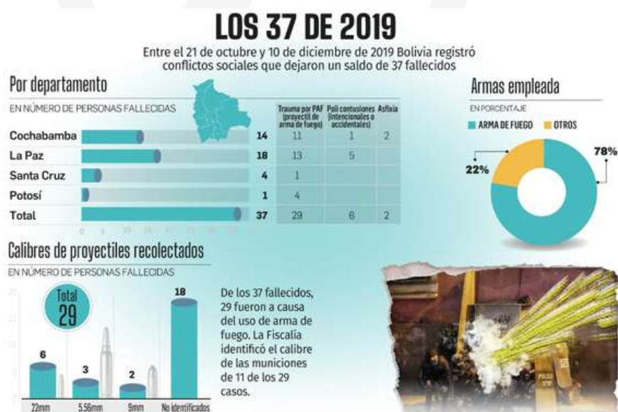
Figura 2: Víctimas de la represión cometida por la presidenta provisional Jeanne Áñez posterior a la salida de Evo Morales

Nota. En el gráfico se puede evidenciar el recuento de víctimas habidas por la represión durante la espera por la convocación de nuevas elecciones durante el año 2019.